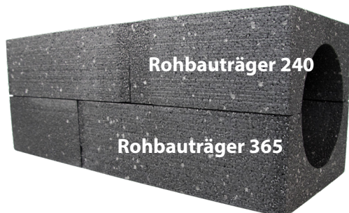
Ab 365 mm Mauerstärke kombinierbar.

Der Rohbauträger besteht aus EPS und wird während der Rohbauphase in die Wand eingemauert. Das macht eine nachträgliche Kernlochbohrung überflüssig. Der Rohbauträger kann beliebig an die Wandstärke angepasst werden. Ab 365 mm Mauerdicke werden zwei Rohbauträger kombiniert.