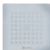
Ice - 1