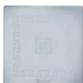
Ice - 3