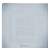
Ice - 5