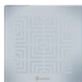
Ice - 4