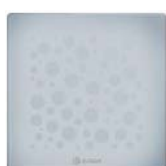
Ice - 2