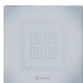
Ice - 6