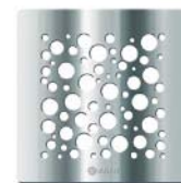
Lux - 2