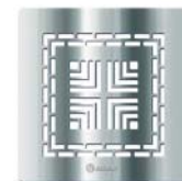
Lux - 5