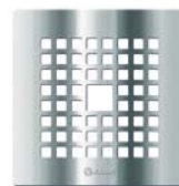
Lux - 1