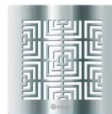
Lux - 4