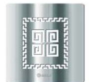
Lux - 6