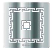
Lux - 3